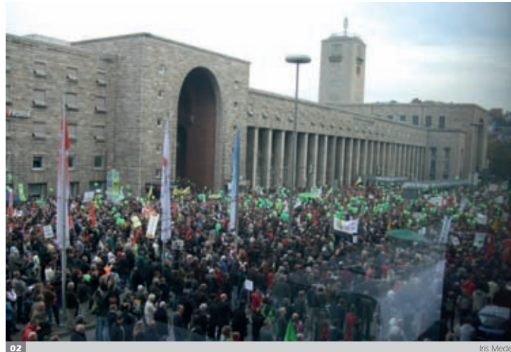
02 Iris Meder

Die Perioden mit den alten Bahnhöfen respektvoll umzugehen, waren nie sehr ausgeprägt. Die